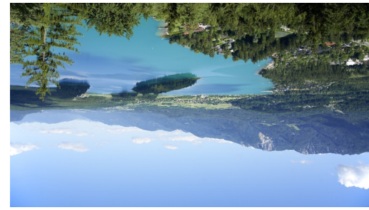
Faaker See Foto: Region Villach, Region Villach - Faaker See - Ossischer See