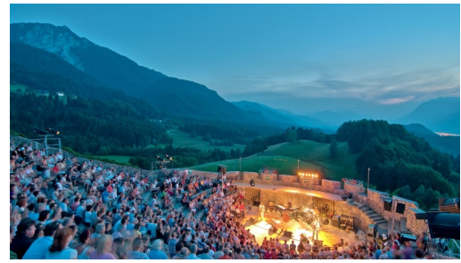
Burgruine Finkenstein