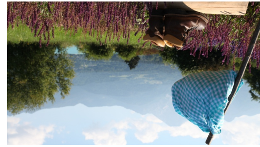
Faaker See Foto: Region Villach, Region Villach - Faaker See - Ossischer See